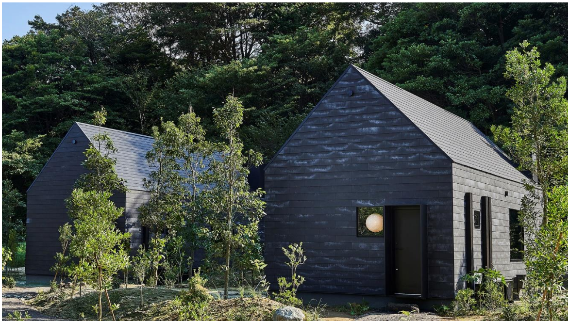
コテージ「五浦 幽谷隠田跡温泉 源泉掛け流し&グランピング」茨城, 五浦