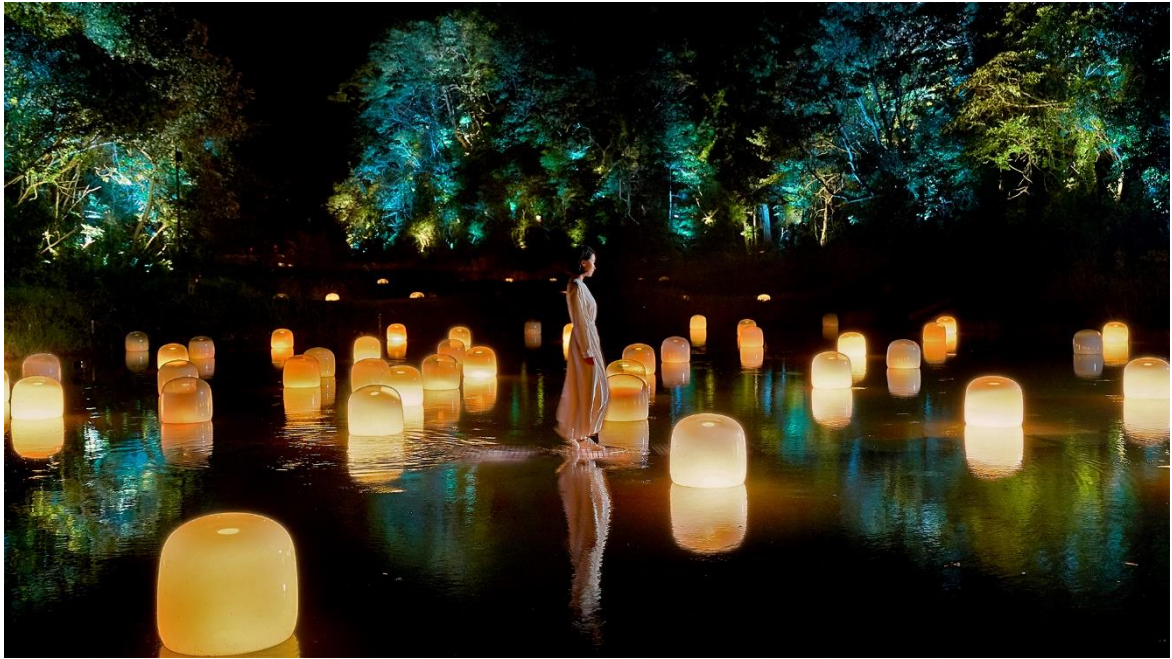
チームラボ《隠田跡の水鏡の道》 ©チームラボ