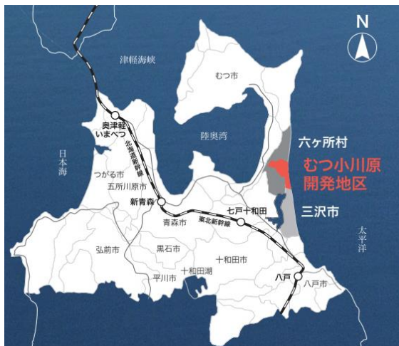
「むつ小川原開発地区」は、青森県六ヶ所村及び三沢市に位置する約5,180haの大規模産業立地スペースです。国家石油備蓄基地、原子燃料サイクル施設に加え、太陽光発電設備や風力発電設備、フュージョンエネルギーの研究設備等、多様なエネルギー関連プロジェクトが集積しています。

同時に、RD社は環境保全や地域振興に配慮しながら事業を推進することとしており、本事業は六ヶ所村の「再生可能エネルギー促進による農山漁村活性化基本計画」において、農林漁業の健全な発展と調和のとれた再生可能エネルギー事業として位置づけられています。