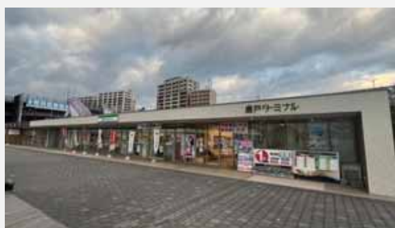
『唐戸旅客ターミナル等整備事業』 (下関市 港湾局 経営課)