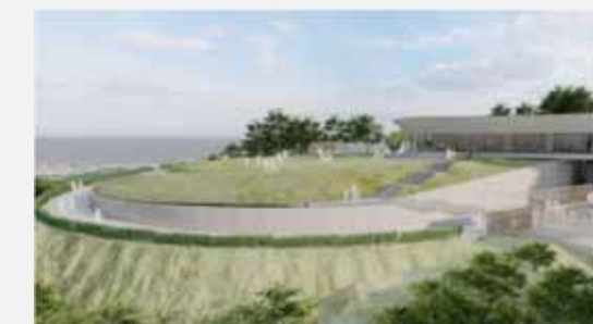
『火の山地区観光施設再編整備事業』 (下関市 公園緑地課)