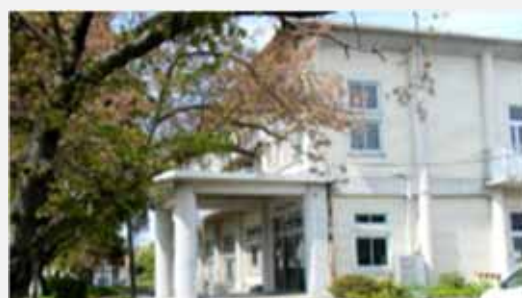
『旧宇部市立図書館の活用について』 (宇部市 学びの森くすのき・地域文化交流課)

中心市街地から近い立地にある火の山公園の再整備を検討している。山頂部では、子供向けアスレチックや展望台、山麓部ではキャンプ場や立体駐車場が整備予定である。各施設を効果的かつ効率的に管理運営していくために、どのような管理運営の手法が考えられ、有料施設の料金設定（割引を含む）はどのようなものが考えられるのか等に加え、カフェの誘致や運営形態などについてもアイデアを募る。