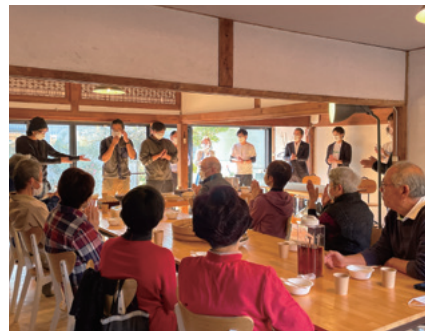
『そらや』交流会の様子