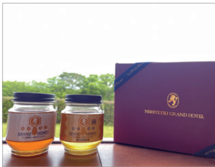
蜜蝋を商品化した新製品『グランドハニー』