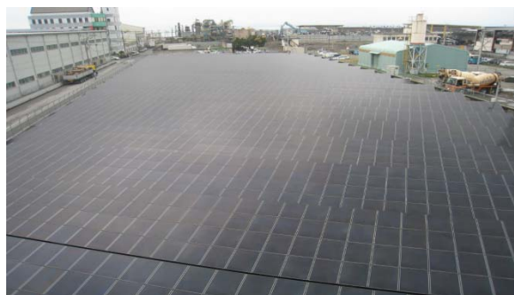
※2 大分太陽光発電所 (大分県)