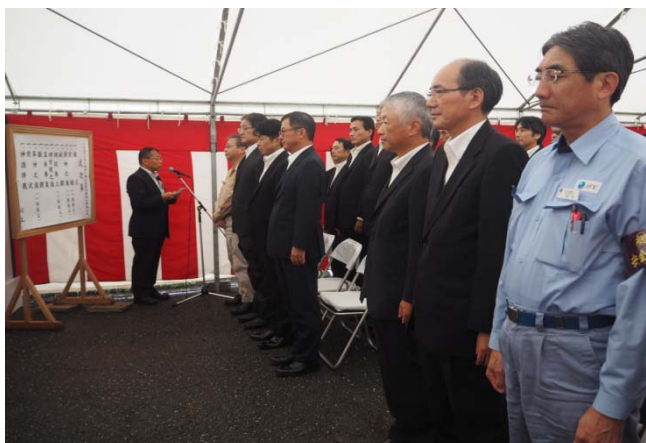
〈竣工式 神事の様子〉