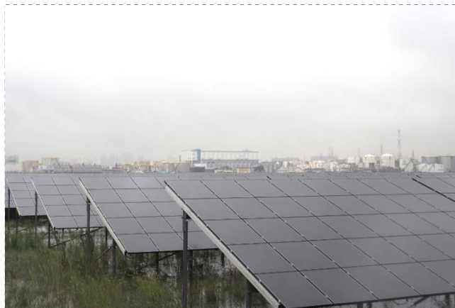
〈扇島太陽光発電所〉