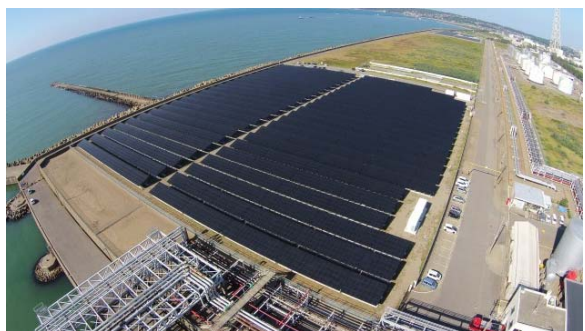
※5 福井太陽光発電所 (福井県)