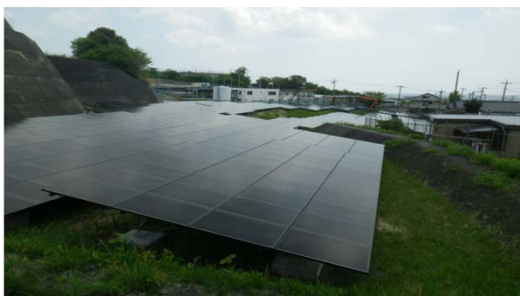
※1 日立太陽光発電所 (茨城県)