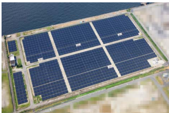
〈扇島太陽光発電所〉