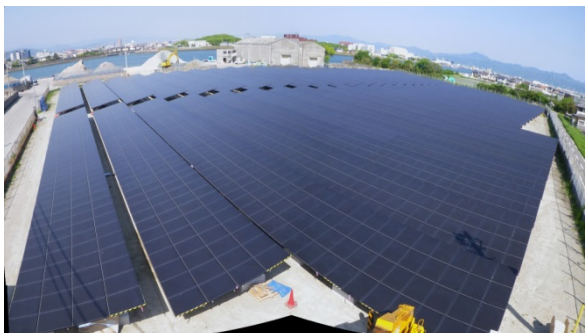
※3 徳島太陽光発電所 (徳島県)