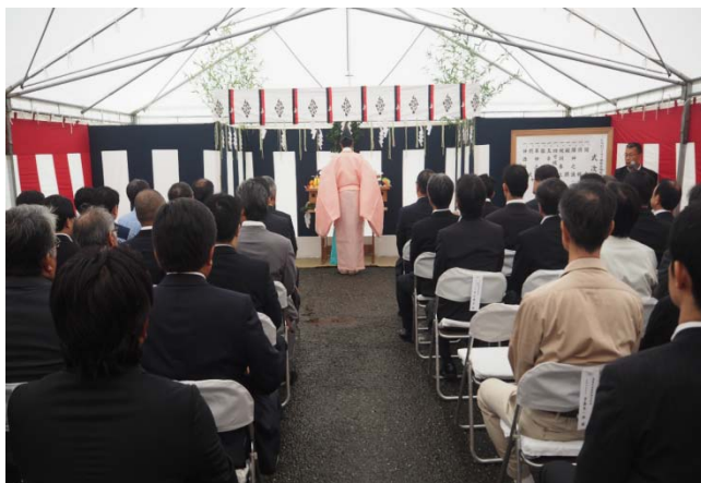
〈竣工式 神事の様子〉