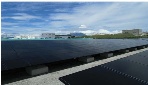
※4 谷山太陽光発電所 (鹿児島県)